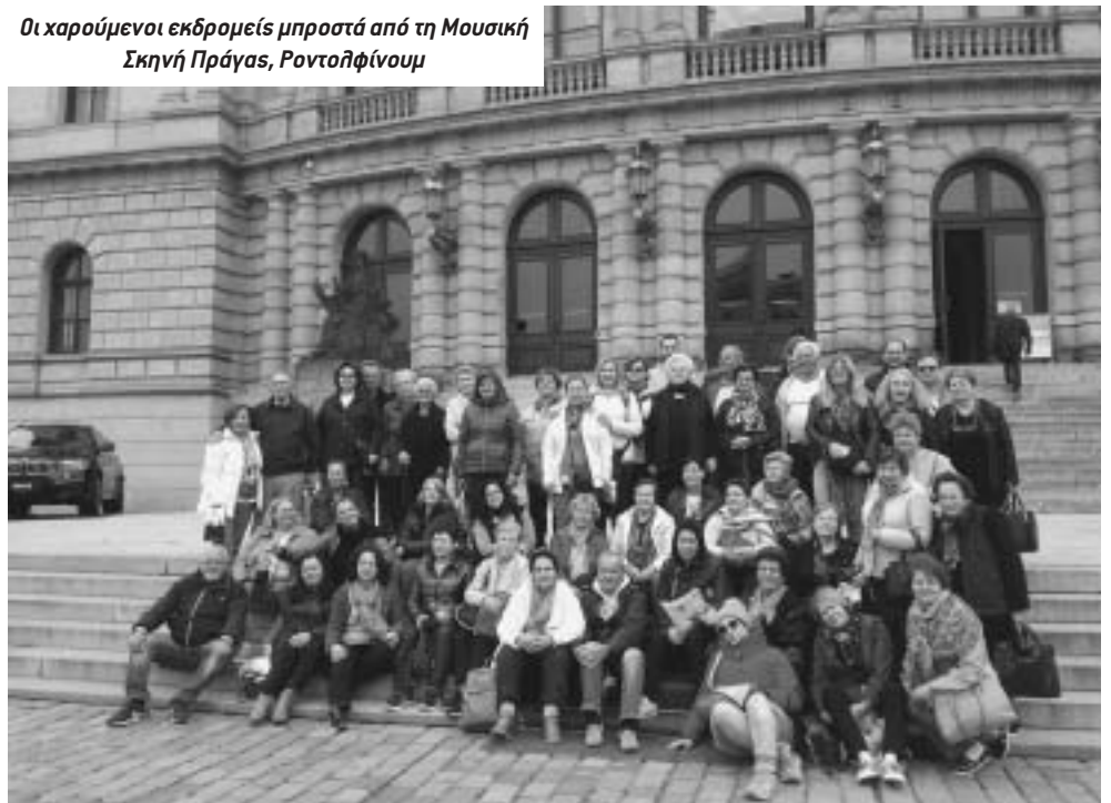
Οι χαρούμενοι εκδρομείς μπροστά από τη Μουσική Σκηνή Πράγας, Ροντολφίνουμ

Από την Πράγα αναχωρήσαμε με τις καλύτερες εντυπώσεις. Επόμενος σταθμός μας ήταν η μοναδική Βιέννη. Αρχικά επισκεφτήκαμε τον πύργο Donauturm που είναι το υψηλότερο κτήριο της Βιέννης με ύψος 325μ. Μας κόπηκε η ανάσα καθώς βλέπαμε την απίστευτη θέα της πόλης που απλώνονταν κάτω από τα πόδια μας και όλα αυτά εν κινήσει, αφού ο πύργος γύριζε. Με το λεωφορείο κάναμε ένα σύντομο γύρο στην περίφημη Λεωφόρο Ρινγκ Στράσε, όπου είδαμε το ανάκτορο του Χόφμπουργκ, τα δίδυμα μουσεία Ιστορίας της