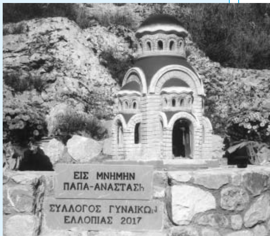
Το εικονοστάσι στη μνήμη του παπα Αναστάση