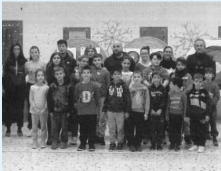
Στιγμιότυπο από το τουρνουά τοξοβολίας

✓ Στις 29/12 διεξήχθη το 1ο τουρνουά τοξοβολίας στο Πνευματικό Κέντρο Δομβραΐνας. Συμμετείχαν αθλητές από όλα τα ηλικιακά «γκρουπ». Σε όλους τους συμμετέχοντες/νικητές απονεμήθηκαν αναμνηστικά διπλώματα και μετάλλια. Θα θέλαμε να ευχαριστήσουμε το δάσκαλο/προπονητή μας κ. Νίκο Μπαλιάμη και να σας ενημερώσουμε ότι το επόμενο ραντεβού μας θα πραγματοποιηθεί την Τρίτη 9 Ιανουαρίου 2018. Σας ευχόμαστε ολόψυχα καλή και ευλογημένη χρονιά με υγεία, αγάπη και ευτυχία.