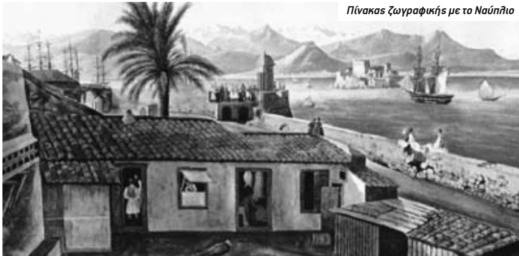
Πίνακας ζωγραφικής με το Ναύπλιο

Προχώρησε στην οργάνωση του άτακτου στρατού σε τακτικό, κατέστειλε την πειρατεία. Ο στόλος υπάγεται στη δικαιοδοσία της κυβέρνησης και όχι στους караβοκύρηδες. Ίδρυσε τη Στρατιωτική Σχολή Ευελπίδων, το Εθνικό Νομισματοκοπείο και καθιέρωσε τον Φοίνικα ως εθνικό νόμισμα αντικαθιστώντας το τουρκικό γρόσι. Κατασκεύασε σχολεία, εισήγαγε τη μέθοδο του αλληλοδιδασκτικού, όπου ο μοναδικός δάσκαλος, δίδασκε με τη βοήθεια των «πρώτων», που διακρίνονταν για την ικανότητά τους να διευθύνουν τους συμμαθητές τους, την επίδοση στα μαθήματα και τη διαγωγή τους. Ακολουθώντας την παράδοση του Αγίου Κοσμά του Αιτωλού θεωρούσε και αυτός την παιδεία αχώριστη από την εκκλησιαστική ζωή και απέκρουε τη μονομερή ανάπτυξη του πνεύματος χωρίς την χριστιανική διάπληση της καρδιάς.