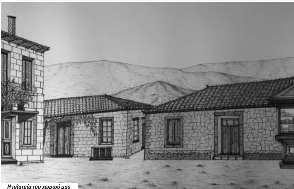
Η πλατεία του χωριού μας