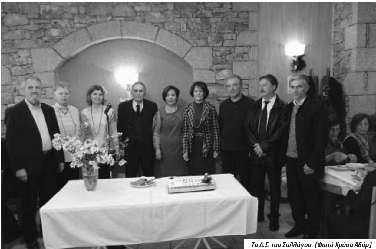
Το Δ.Σ. του Σύλλογου.

Ακολούθησε η κοπή της πατροπαράδοτης πίτας, που ευλό-